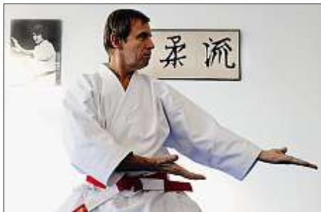
ART. Une discipline d'épanouissement physique et mental.